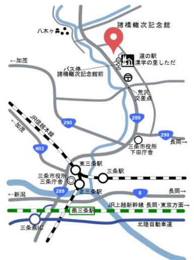
諸橋轍次記念館アクセス図